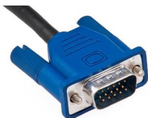
Figur 1: VGA-kabel

Steg 1: Kontrollera att alla sladdar är i! Om inte, koppla in dem! Beroende på vilken tillställning och vilket sammanhang presentationen ska äga rum i, så kan det ibland vara så att det är en HDMI kabel som är kopplad till projektorn men du har kopplat in en VGA-kabel i datorn (eller tvärtom). Lär dig skillnad på de kablarna och om du har en dator med bara det ena uttaget, var noga med att fråga arrangörerna vilka kablar som finns. Dessa är de vanligaste bildskärmsanslutningarna men det finns ytterligare ett par som exempelvis DVI och Displayport. Vill du vara på den säkra sidan fundera på att investera i en adapter, något som är extra viktigt om du har en Mac.