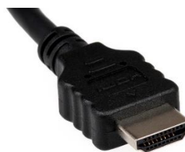
Figur 2: HDMI-kabel